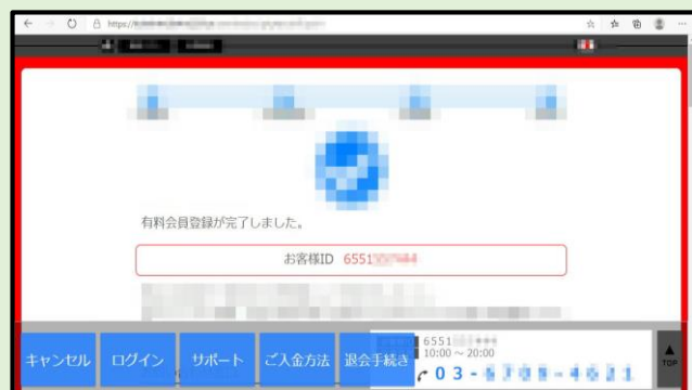
有料会員登録完了の画面が